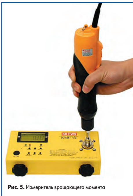
Рис. 5. Измеритель вращающего момента

щеток зависит от интенсивности использования инструмента. Замену щеток может осуществить сервисная служба любого производства. Естественно, как любой механизм, винтовёрты изнашиваются, и со временем потребуются их ремонт. Весь электроинструмент, который выпускает компания Kilews, полностью ремонтнопригоден. В Россию возможна доставка любых запасных частей.