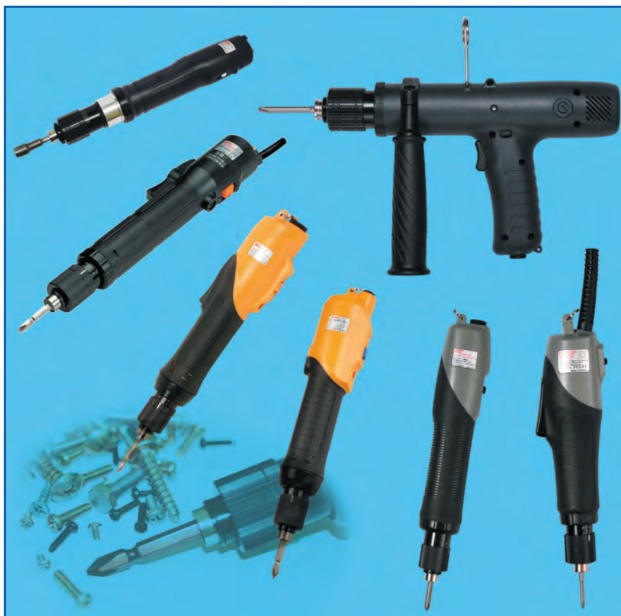
Рис. 1. Электрические винтоверты Kilews

В совокупности выпускаемые электрические винтоверты перекрывают широкий диапазон установки предельного крутящего момента от 0,02 до 15 Н/м, что обеспечит затяжку соединений с диаметром метрической резьбы от 1 до 10 мм. Все винтоверты оборудованы переключателем, обеспечивающим реверс вращения.