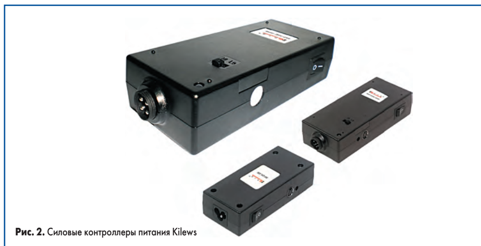
Рис. 2. Силовые контроллеры питания Kilews

Винтоверты с питанием переменным током наиболее просты и надежны. Питание их осуществляется непосредственно от сети переменного тока с напряжением 220–240 В, 50/60 Гц. Все винтоверты оборудованы постоянным заземлением через 3-проводной шнур питания.