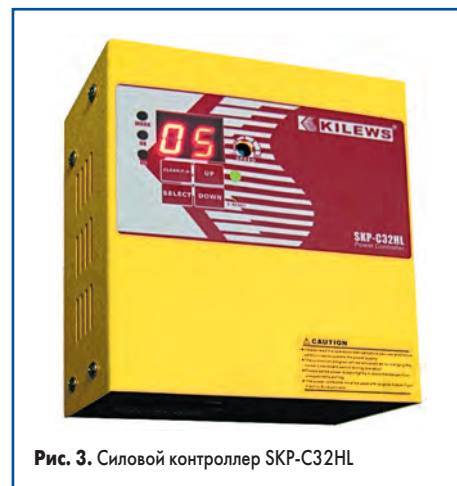
Рис. 3. Силовой контроллер SKP-C32HL

Помимо стандартных силовых контроллеров питания компания Kilews производит различные контроллеры, расширяющие функциональные возможности инструмента. Например, при использовании контроллера плавного старта появляется возможность пуска винтоверта с начальной фазой пони-