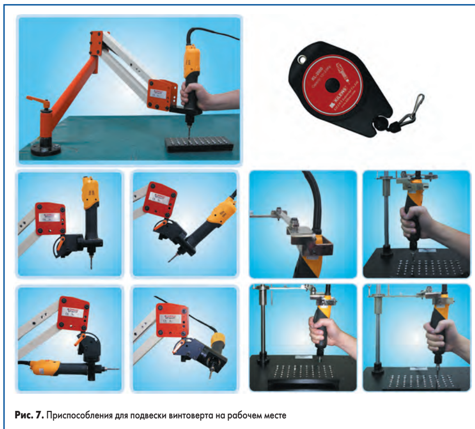
Рис. 7. Приспособления для подвески винтовёрта на рабочем месте

Крепежные изделия можно подготовить для работы и без специального устройства для автоматической подачи, используя специальные кассеты. Конусообразные отверстия позволяют при встряхивании кассеты устанавливать