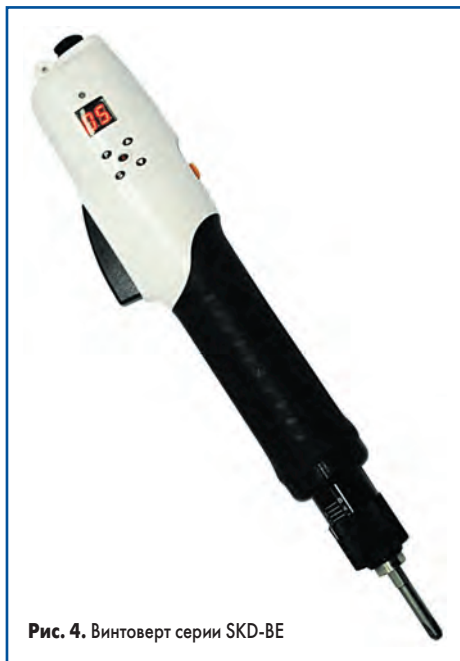
Рис. 4. Винтовёрт серии SKD-BE