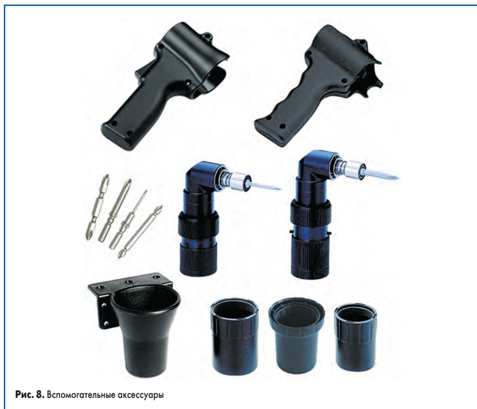
Рис. 8. Вспомогательные аксессуары

винты, саморезы и т. п. в ячейки головками вверх, после чего их легко захватить битой винтовёрта. Тип кассеты определяет диаметр резьбовой части крепежных изделий, для которых она предназначена (КВ-1: Ø1,7–2 мм; КВ-2: Ø2–2,6 мм; КВ-3: Ø3–4 мм).